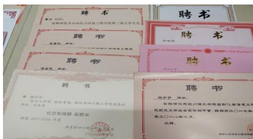
图 3 社团活动聘书