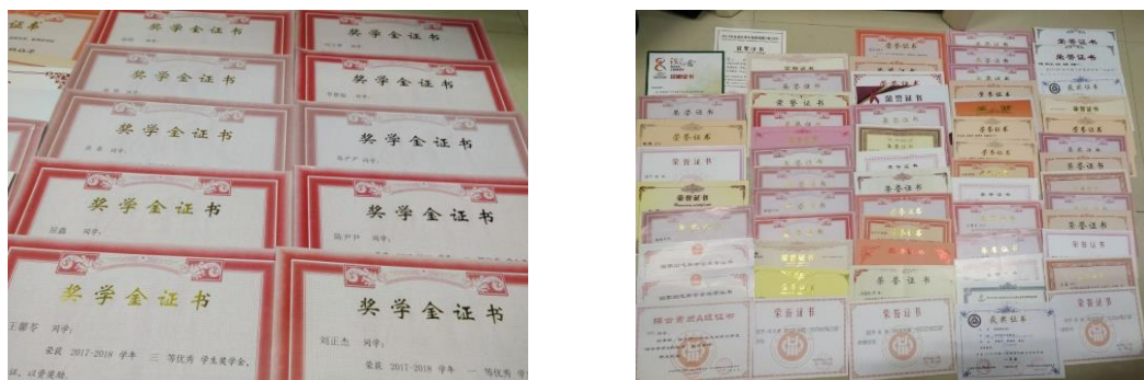
图 2 荣誉证书

大学里，学习仍然是重中之重。加之本学年情况特殊，大多数同学在学习专业课程的同时也需要着手准备考研复习。为了让大家有计划，合理分配时间，科学的进行复习，我们组织了与上一届考上研究生的学长学姐面对面交流沟通的考研座谈会，同学们在此期间积极提问，了解考研现状，学习复习经验教训。