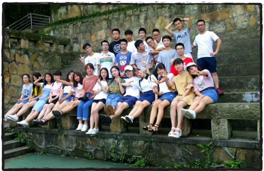
医工 2016 级 2 班班集体风采