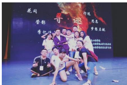
图 4 文体活动选图

(4) 清明扫墓。2019 年 4 月 5 日清明节，组织班上的同学去翠屏山公园为赵一曼同志扫墓，在紧张的复习之余，让同学能有意义的外出放松，回到学校后很多同学都为这次活动点赞。